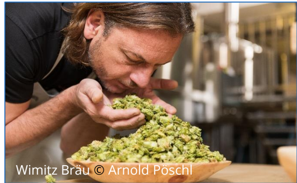
Wimitz Bräu

Bei der Führung durch die seit 2011 bestehende Wimitz Brauerei erleben Sie die Herstellung von naturbelassenem Bio-Bier hautnah, verkosten die gebrauten Köstlichkeiten direkt an der Quelle und machen sich ein beeindruckendes Bild über die Sortenvielfalt, Echtheit und Abenteuerlust hinter des „gefährlich ehrlichen“ Wimitz Bräus.