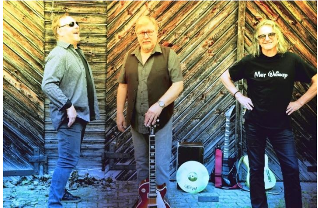
Friends © Guggenbichler

office@eboardmuseum.com www.eboardmuseum.com