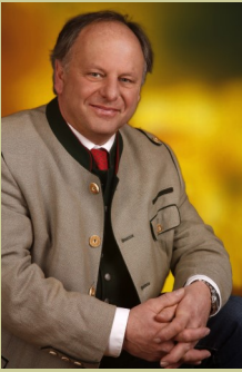
Bürgermeister Hans Fugger